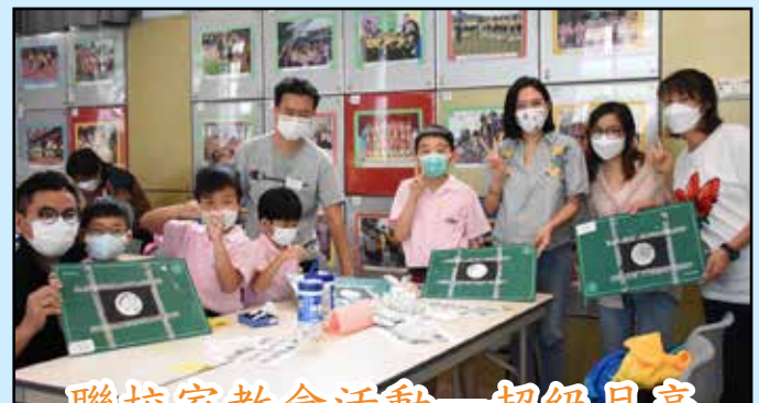
聯校家教會活動—超級月亮