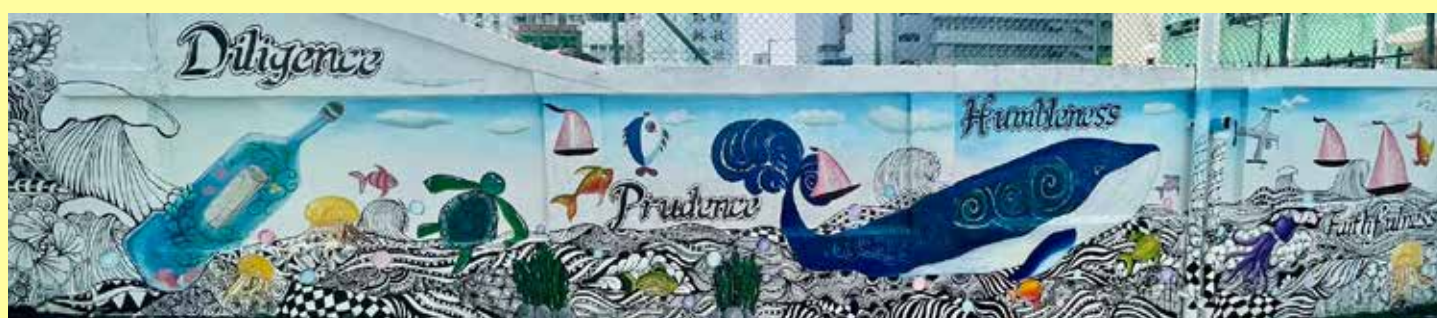
師生、校友共同參與禪繞畫壁畫創作