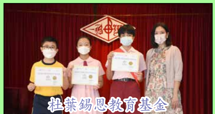
杜葉錫恩教育基金 全港青少年進步獎