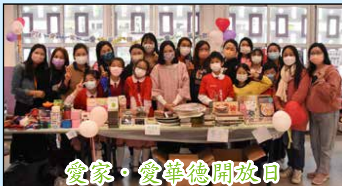
愛家·愛華德開放日 家長義賣