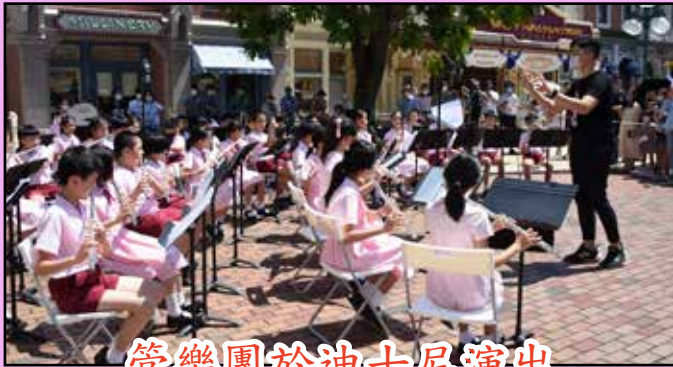
管樂團於迪士尼演出