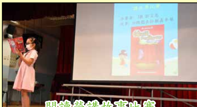
閱讀營講故事比賽