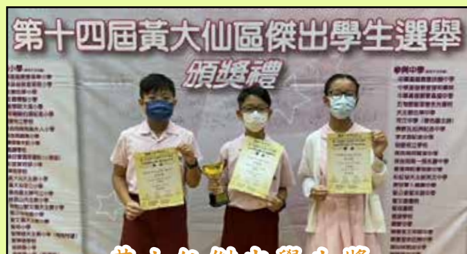
黃大仙傑出學生獎