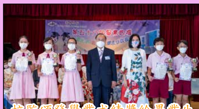
校監頒發學業成績獎給畢業生