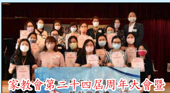
家教會第二十四屆周年大會暨 第二十五屆委員就職典禮