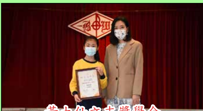
黃大仙文志獎學金