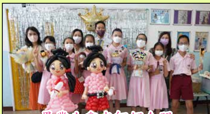
畢業生與老師們合照