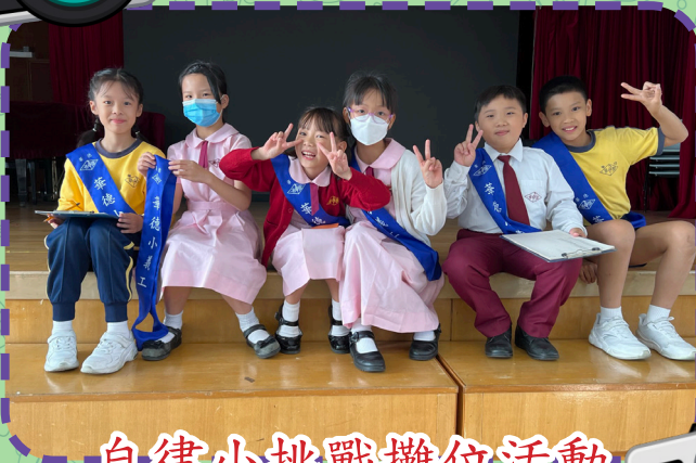
自律小挑戰攤位活動