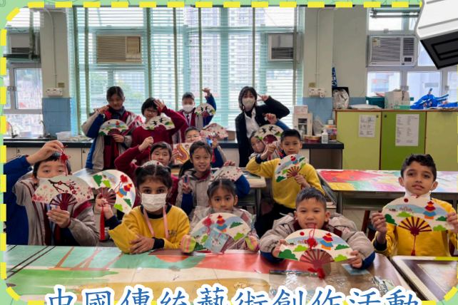
中國傳統藝術創作活動