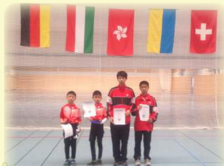
在精英雲集的賽場中，我們絕不渺小