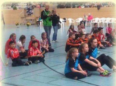
與來自世界各地的選手一起練習